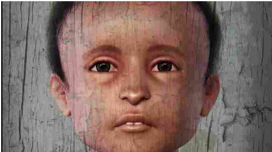
Il volto della mummia ricostruito in 3D

Modena, 13 settembre 2019 - È stato svelato al pubblico, nell'ambito del Festivalfilosofia in corso a Modena (foto) fino a domenica, il volto ricostruito in 3D della mummia della collezione egizia dei Musei civici di Modena . Le analisi